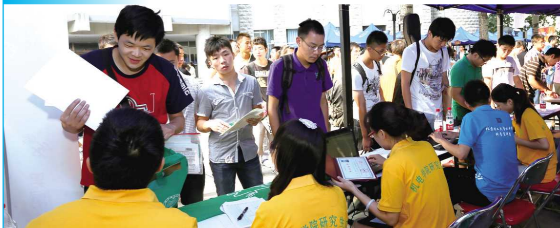
9月2日,我校2013级研究生新生报到,2013级研究生共计3700余名,其中博士研究生600余名,新同学的到来为美丽的校园带来了蓬勃向上的新气象。希望新同学们,在北理工健康快乐发展,刻苦努力学习,在一段全新的人生旅途上,取得成功,插上北理工的翅膀,展翅高飞,实现人生梦想。