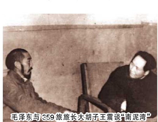
毛泽东与359旅旅长王震谈“南泥湾”

回来以后,三人寻找时机,要向中央详细汇报这次的考察结果。一天,延安农业界人士来到边区农校的一间教室内畅谈发展边区农业生产的感想,主持座谈会的是党中央工管大生产运动的八路军总司令朱德同志。席间乐天宇抓住时机向总司令介绍这次考察经历,他发言说:“土能生万物,地可降千祥。土地祠前的对联,真是我们人类科学的总结,发展大生产,必须有生万物的土地。这次毛主席要我和王首道、邓洁三人去考察了一个地方,那个荒凉的处女地真是一块宝地。它在延安县南边80里,从固临镇进去有大片土地,方圆80余里。那里土地广阔肥沃,人烟稀少,形成一个适宜生产的小气候圈。那里有田地,有森林,有丘陵,有水草,种什么出什么。那个地方,要是移民植垦,将是一个不可多得的粮仓;如果屯兵于农,又是巩固边区的堡垒。”朱老总听得十分认真,当他听到乐天宇谈到那个地方:要是移民农垦就是一个天然粮仓,要是屯兵于农就是一个巩固边区的堡垒时,朱德开口道:“囤民、移民、牵涉面大,这是我们边区政府和八