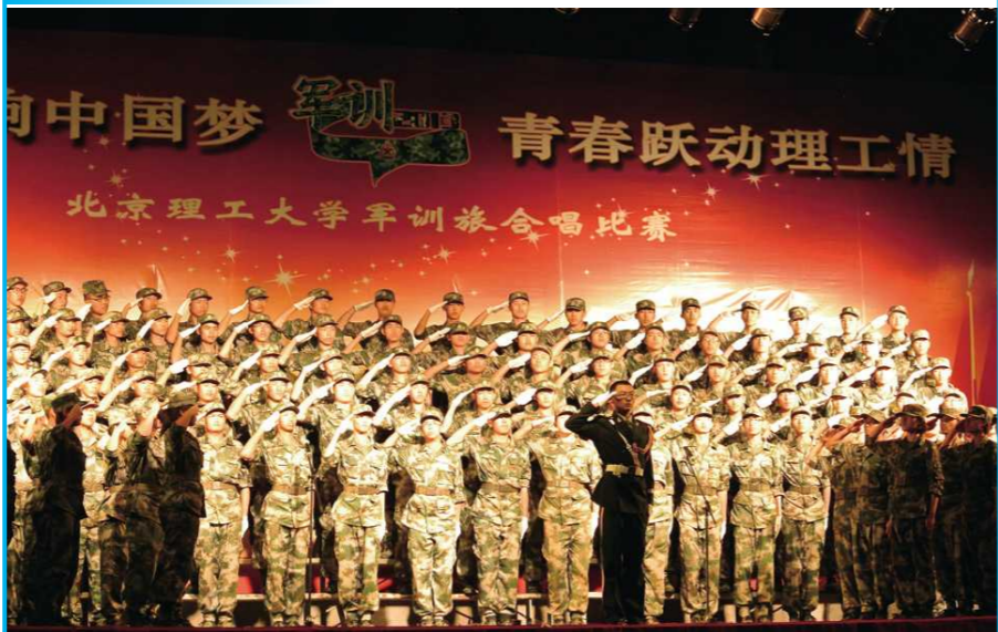
军歌唱响中国梦 青春跃动理工情。9月5日晚,我校2013级新生军训合唱比赛在良乡校区南操场举行。合唱比赛过程精彩纷呈,高潮迭起,时而激情澎湃,时而婉转悠长,伴随着优美的旋律,他们歌颂祖国,歌唱青春。各营的合唱都融合了独具特色的表演:热血男儿的诗朗诵,绿装红颜的乐器表演,精心排练的动作都展现了北理工学子的青春风貌。(文/军训指挥部 辛嘉洋)